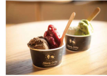
気軽に立ち寄れるジェラテリアも併設。京都×淡路島×瀬戸内のジェラートが楽しめます。

昭和初期に建てられた歴史的建物をリノベーションした「Hotel 宇多野京都別墅」。書院造、数寄屋建築の意匠が色濃く表現された瑞雲風やアール・デコ風の洋館など、10室の客室すべてに温泉風呂を備えます。この夏は、街中の喧騒から離れた静寂の別邸で心穏やかなひと時を過ごしてみませんか？ホテル周辺の京都西エリア巡りでは、龍安寺の鏡容池に浮かぶ睡蓮が花を咲かせ、夏の風物詩として人気です。ほかにも嵐山の竹林の小径、保津川下り、三つの世界遺産を繋ぎきぬけがの路など、散策に訪れていきたい名所へのアクセスも至便。美しい自然と古都の歴史に想いを馳せる、夏の京都旅へ。御食国・淡路島から届く美食の数々も、この旅の楽しみのひとつです。