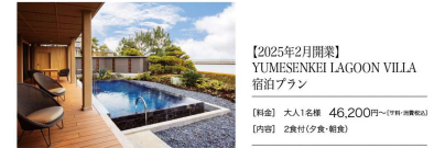
【2025年2月開業】YUMESENKEI LAGOON VILLA 宿泊プラン

淡路夢泉本館の南側、眼前に渚が広がる開放的な敷地に約100~200平米の広さを誇る、露天風呂付ラグジュアリースイートが新たにオープンしました。200平米超もの広さを誇る最大タイプの客室には、洲本温泉をなみなみと湛えた温泉露天風呂のほか、温泉水を使ったプライベートプールやサウナもご用意。湾内が一望できる専用ラウンジではウェルカムデザートをはじめ、夕食前後の時間帯に合わせて、スイーツ・スナックとともにドラフトビールや地元産などが自由に愉しめます。朝食は淡路島の新鮮な海の幸や地元野菜、淡路牛を使った朝食セットをラウンジにてご用意。夕食はグループホテルのダイニングや地元の人気店など、お好みに合わせて淡路島グルメを思う存分堪能いただけます。自由気ままで贅沢なホテルステイをどうぞお楽しみください。