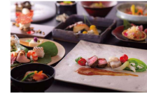
開業記念★御食国・淡路島と京都の美食を愉しむ懐石ディナー